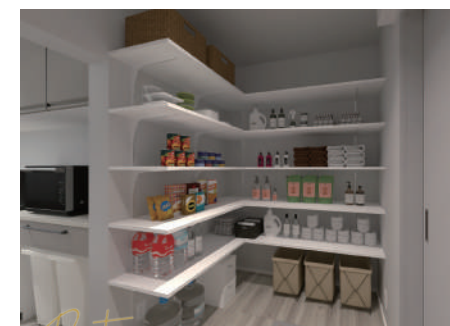
Pantry 日用品も食料品もまとめて収まる、 大容量収納のリネンパントリー