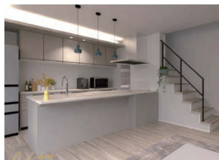
Kitchen 家事ラクの食洗機付きで、 IH対応のタカラスタンダードキッチン